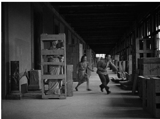
Païsa (Roberto Rossellini, 1946)